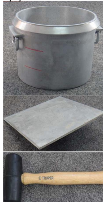
Figura 8 Equipo del Peso Unitario