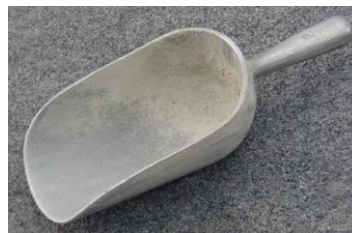
Figura 7 Cucharón