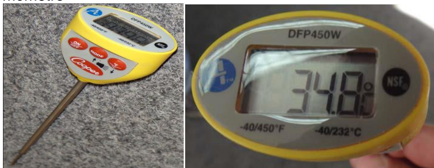
Figura 2 Termómetro