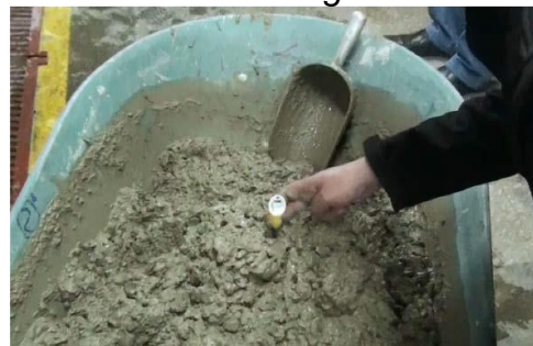
Figura 3 Muestreo del Hormigón

Si solo se obtiene temperatura se puede prescindir de muestra compuesta.