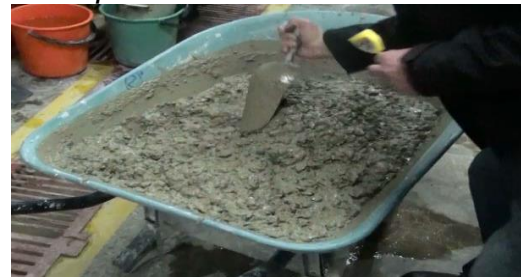
Figura 1 Recipiente

Deben tener marca permanente para mostrar hasta donde deben insertarse