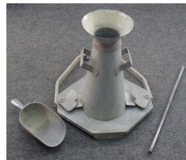
Figura 6 Equipo del Cono de Abrams