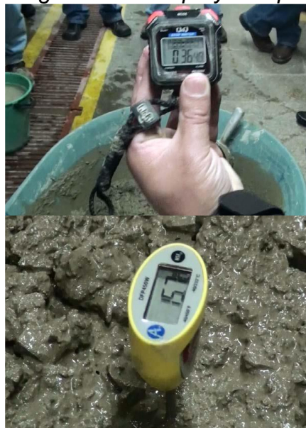
Figura 4 Registro de Tiempo y Temperatura