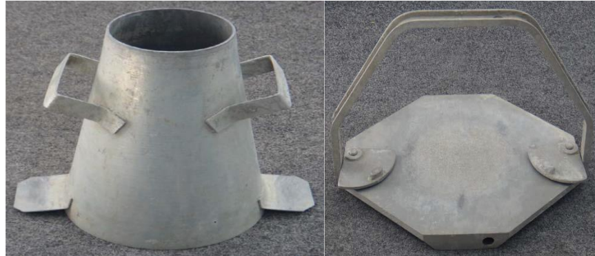
Figura 5 Cono de Abrams

Cucharón de un tamaño lo suficientemente grande como para introducir el hormigón al molde y lo suficientemente pequeño como para que el hormigón no se desparrame durante su colocación.